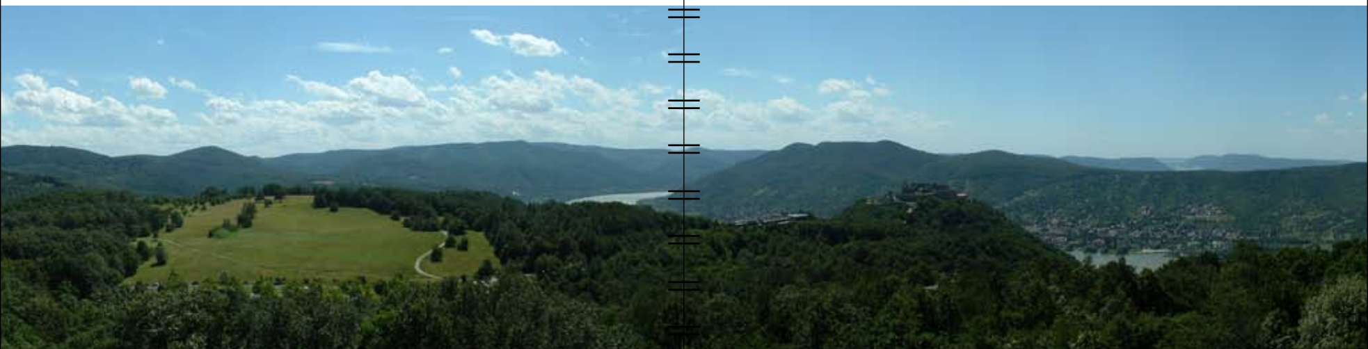
Panorámakép a Julianus-kilátóból