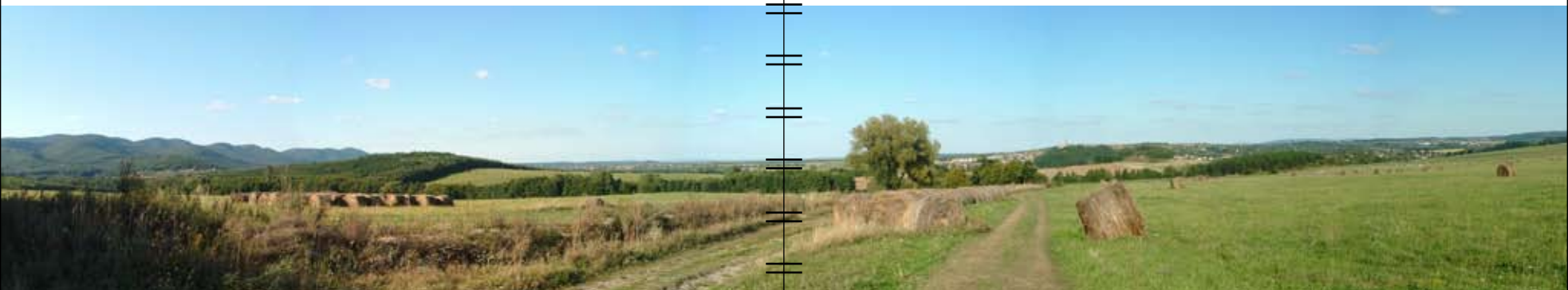
Nógrád – panorámakép