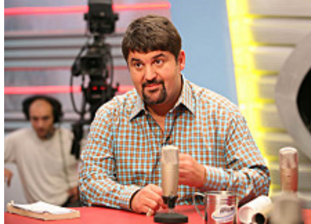
Hagyó Miklós

Bárki csatlakozhat ahhoz az 1128 kilométer hosszú túrához, amely július 11-én indul. A Szent István-vándorlás, illetve az Országos Kéktúra útvonalát 41 nap alatt szeretné megtenni Hagyó Miklós főpolgármester-helyettes.