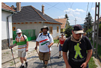
Nincs megállás!

Aki kételkedne a nem mindennapi sportteljesítmény tisztaságában, annak megnyugtatóan itt közöljük, hogy nincs a dologban csalás, nem politikai reklámfogásról van szó. A politikus tényleg gyalogol, kőkemény hegyeket és völgyeket mászik meg mindennap, és eldugott erdei tisztásokon sátrazik. Egyszóval komolyan veszi a megszakítás nélküli teljesítést. Állítása szerint így nyaral.