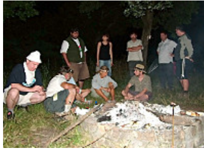
Esti ismerkedés

Folyamatos a hajtás, mivel a napi szakaszokat feltétlenül teljesíteniük kell és ebben senki nem is ismer tréfát. Este pedig jöhet a beszélgetés és az ismerkedés egymással.